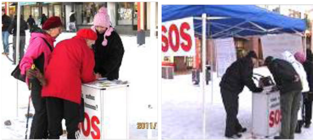
Des habitants de Rovaniemi signent la pétition pour soutenir les efforts des pratiquants pour mettre fin à la persécution

Sur une table, les pratiquants avaient disposé des photos montrant la présence du Falun Dafa autour du monde et la persécution brutale des pratiquants de Dafa par le PCC. De nombreux passants ont été bouleversés par la brutalité de la persécution et ont signé la pétition pour soutenir les efforts des pratiquants pour y mettre fin.